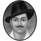
സർദാർ ഭഗത് സിംഗ്